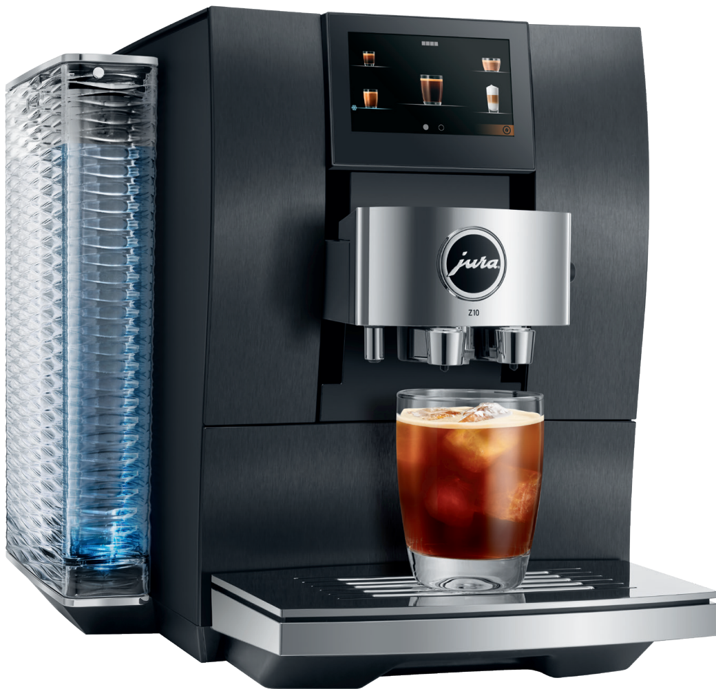
Aluminium Dark Inox (EA)

Eloxierte Aluminiumfront für Luxus in Höchstform