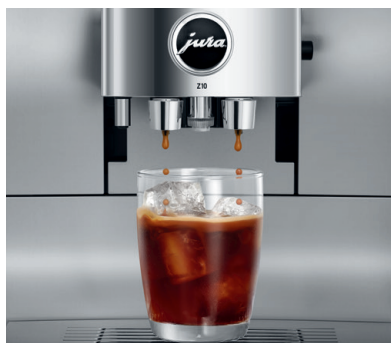
Detaillausschnitt der Z10 Aluminium White